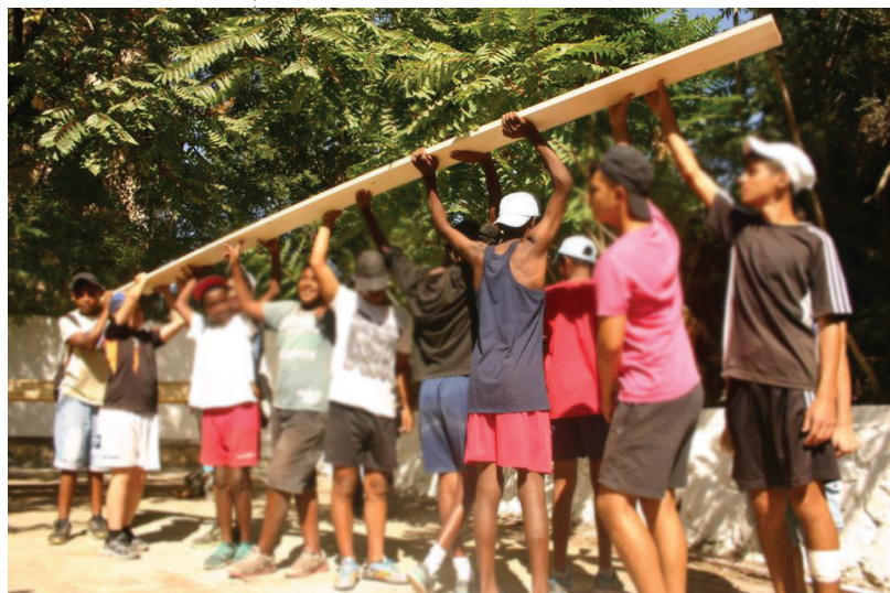
הקמת המתחם, קיץ 2014. הנערים הפכו לסוכנים של קטמונה

קהילתית הממוקם במרחב ציבורי בלב שכונת הקטמונים, באחד הרחובות המורכבים, הצפופים והחלשים בעיר. הגלריה והספרייה שוכנות במבנה ייעודי משותף, אשר תוכנן ונבנה באופן מודולרי המאפשר פתיחה וסגירה של המתחם. כאשר המתחם פתוח לא מפרידות דלתות בינו לבין הרחוב, והחסמים הטבעיים שקיימים בכניסה לגלריות וספריות נעלמים. החצר שבה ממוקמת קטמונה גלויה ונגישה מהרחוב, ובה בעת מאפשרת חוויית ביקור אינטימית באמצעות הסכך הטבעי שהיא מציעה. כאשר המתחם סגור, קירות הגלריה מתקפלים לכיוון הספרייה, וכך נשמרות יצירות